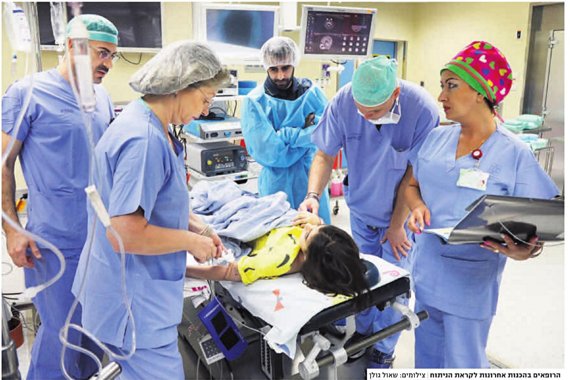
הרופאים בהכנות אחרונות לקראת הניתוח