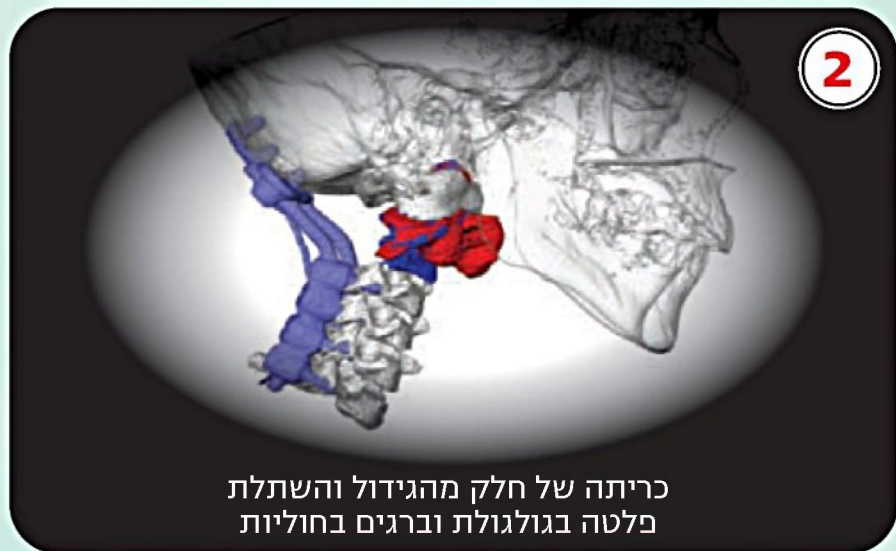
2 כריתה של חלק מהגידול והשתלת פלטה בגולגולת וברגים בחוליות