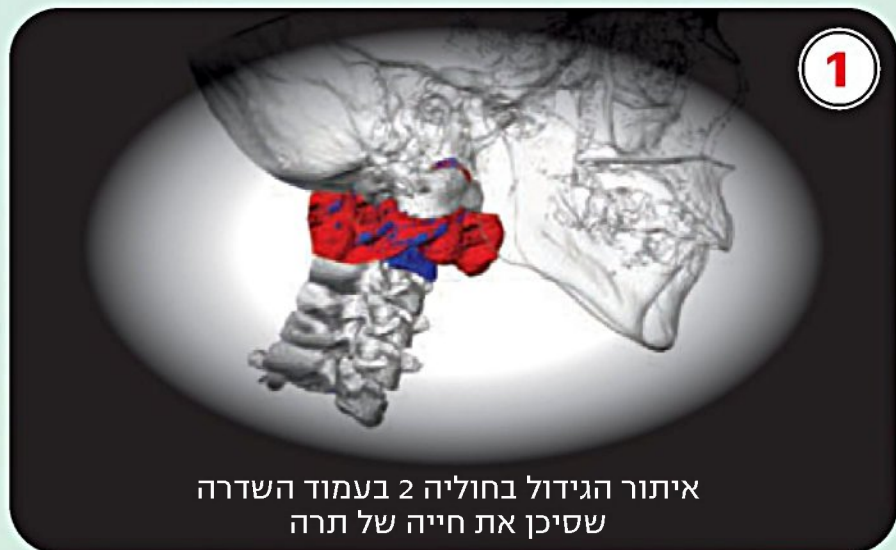
1 איתור הגידול בחוליה 2 בעמוד השדרה שסיכן את חייה של תרה