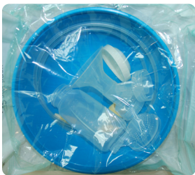
ערכת שאיבה סטרילית

מידע זה בא לתת מענה בנושא הנקה, שאיבה, מתן וחלוקת חלב אם באשפוז. צוות המחלקה ישמח לסייע, להדריך ולענות על כל שאלותיכם. לכל אם המעוניינת לשאוב חלב ניתנת ערכה סטרילית לשאיבת חלב אם. בתום האשפוז, תדרשי להחזיר את הערכה לאחות המשחררת. השימוש בערכה הוא ל-24 שעות, ויש להחליפה מידי יום, מלבד יום שבת, אצל כוחות העזר במחלקה, בין השעות 08:00-14:00.