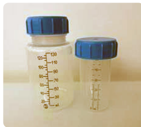
כוסיות לחלב אם