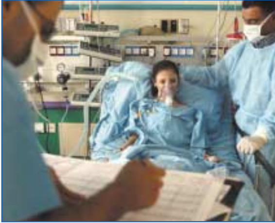
מושתלת הלב בת ה-11 לאחר הניתוח

בזכות תרומת איברים מילד פלשטיני בוצעה השתלה נדירה שאיפשרה את הצלת חייהן של שתי ילדות