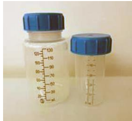
كووس حليب الأم