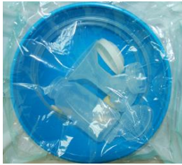
معدات شفط معقمة

تستعمل المعدات فقط لمدة 24 ساعة، ويجب تبديلها يوميًا عدا يوم السبت، لدى الطاقم المساعد في قسم الاطفال الخدج بين الساعات 8:00 و14:00.