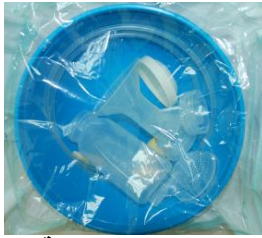
معدّات شفط معقمة

الرجاء الحرص على اعادة كل أجزاء المجموعة لمصلحة باقي الامهات.