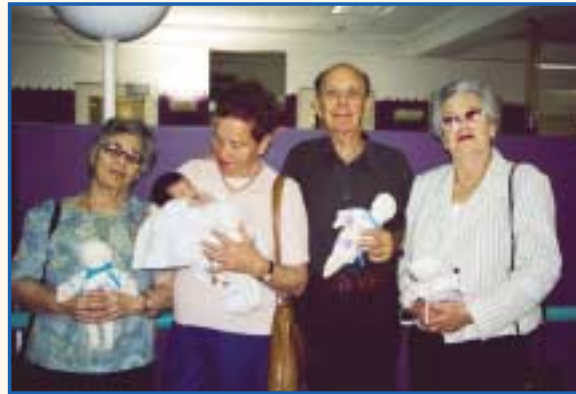
סבא בובה. דיירי מרכז "עד 120" עם הבובות שהכינו לילדי שניידר

בני גיל הזהב תופרים בובות; הילדים מאמצים אותן בנתיב הקשה שהם עוברים במחלקה לטיפול נמרץ לב. פרויקט ייחודי שעוזר להתמודד