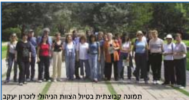
תמונה קבוצתית בטיול הצוות הניהולי לזכרון יעקב