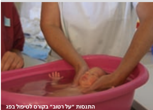
התנסות "על רטוב" בקורס לטיפול בפג