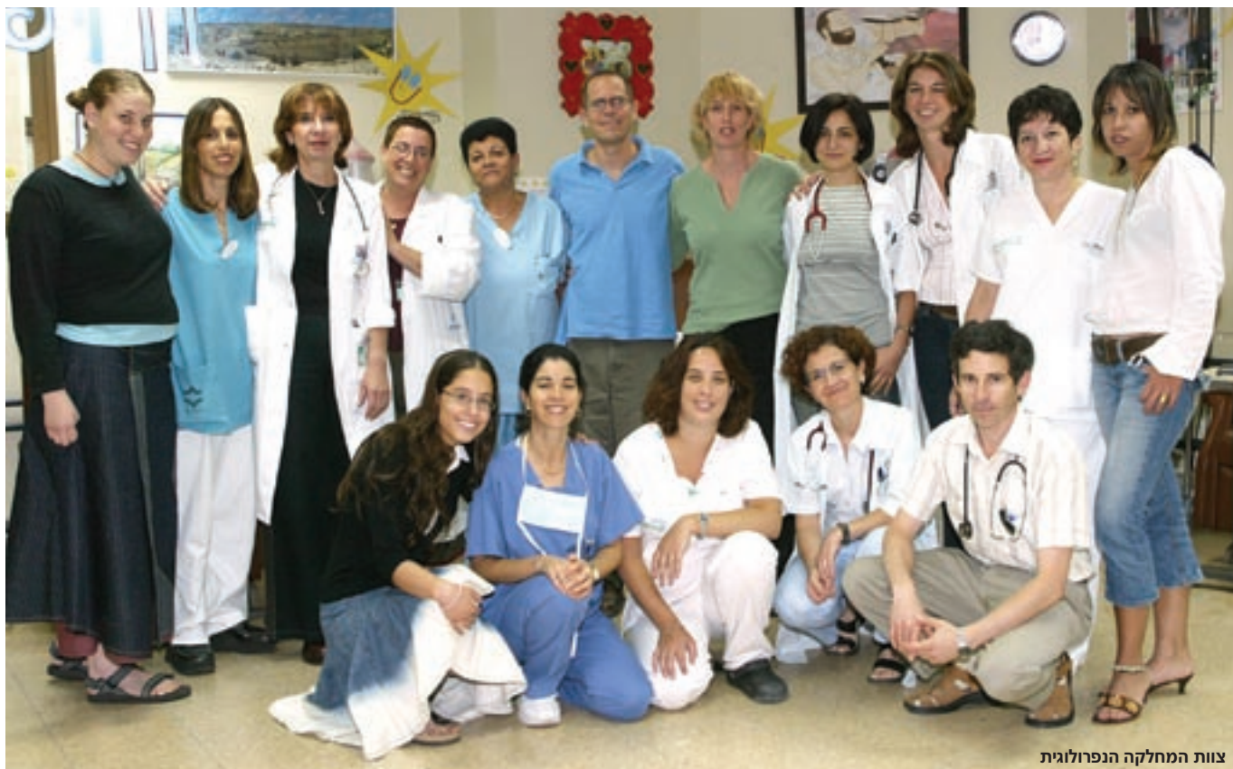
צוות המחלקה הנפרולוגית

קח את אותה נערה מבני ברק, שלפני כמה שנים עברה השתלת کلیה מוצלחת לאחר שנות דיאליזה ארוכות, ולא מזמן באה לבקר אותנו עם שני ילדיה. כשאנו מאפשרים לילד להחזיק מעמד עד להשתלה, והוא שב למסלול של חיים רגילים, לעיתים מתנדב לצה"ל, מקים משפחה - זהו הסיפוק הגדול ביותר שיכול להיות לרופא".